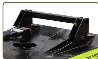
Hållaren för redskapsfästet har rörlighet så kedjehuvudet följer underlaget.