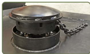
Stallallrik under kedjemagasinet.

Kättinghuvud GreenTec RX 133 är speciellt utvecklat för att användas i svåra/tuffa förhållanden. Uppbyggt av Strenx 700® (SSAB) höghållfasthetsstål vilket ger en lättare och starkare kättinghuvud. Kättinghuvudet slår och fördelar gräs och sly upp till 70 mm diameter, detta utförs av kedjor eller knivar. Kättinghuvudet kan utrustas med HD knivar (3 st), kedjor (3 st 13mm) eller kedjemagasin för 10 eller 13 mm kedja, kedjor är att föredra vid steniga förhållande. HD knivarna ger sugeffekt för bättre röjning resultat. Infästningen är en justbar rörlig pendelupphängning med flytläge vilket gör att huvudet följer underlaget. Fronten på kättinghuvudet är försedd med tryckreglerad lucka som vid belastning öppnar sig och sedan återgår till ursprungsläget.